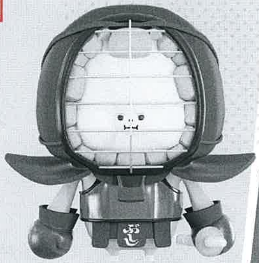
剣道普及キャラクター 「ぶし」

剣道界最大のイベントである国際剣道連盟主催の「世界剣道選手権大会 (WKC)」。令和 9 年 (2027) に日本で開催される「第 20 回世界剣道選手権大会 (20WKC)」を契機に、全日本剣道連盟 (全剣連) の WKC に関する活動を支援し、国内外への剣道振興に繋げる「剣道世界大会応援クラブ」を創設します。剣道愛好者のみなさまから賜りましたご支援を原資として、全剣連の WKC 活動及び積極的な国内外での普及活動に活用させていただく制度です。みなさまのご賛同よろしくお願いいたします。